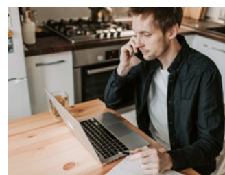
8 Overige eerder aangekondigde en te verwachten voorstellen