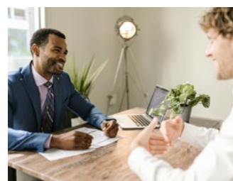
4 Tips voor werkgevers