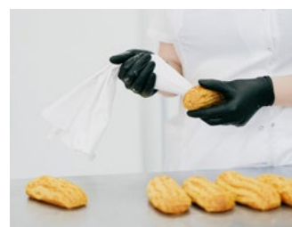
8 Tips inzake belasting-schulden coronacrisis en/of huidige (energie)crisis