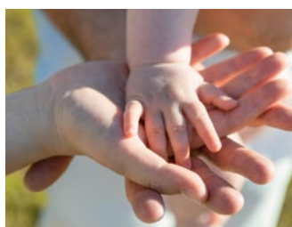
1 Tips voor alle belastingplichtigen

Een aantal plannen van het kabinet is nog niet definitief. Deze moeten nog door de Eerste Kamer worden goedgekeurd. Welke dat zijn, kunnen wij u uiteraard vertellen. Ook worden nog steeds nieuwe plannen bekendgemaakt of worden er huidige plannen aangepast. Daarom overleggen wij graag met u of het verstandig is wel of geen stappen te zetten.